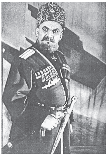
ра Тхапсаева. Но огонек этой мечты продолжал гореть в его

Иногда казалось: жизненная тропа уводит его далеко в сторону от заветной мечты – посвятить себя профессии актера. Чернорабочий, шахтер Садонских рудников, строитель Гизельдонской гидроэлектростанции, студент Краснодарского дорожно-строительного техникума – все это тоже вехи биографии молодого Влади-